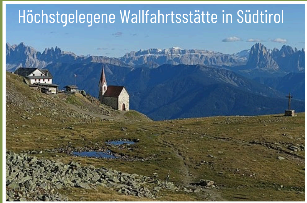
Höchstgelegene Wallfahrtsstätte in Südtirol